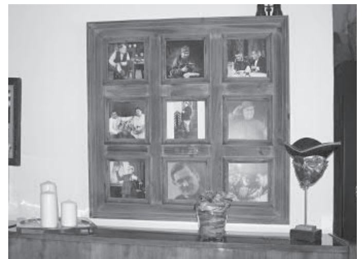
V útulné kavárně ve stylu starých časů je nad klavírem malá Nollova fotogalerie

A takových příběhů a zajímavých osudů pracovníci Vysočina Tourism společně s historiky krajských a regionálních muzeí