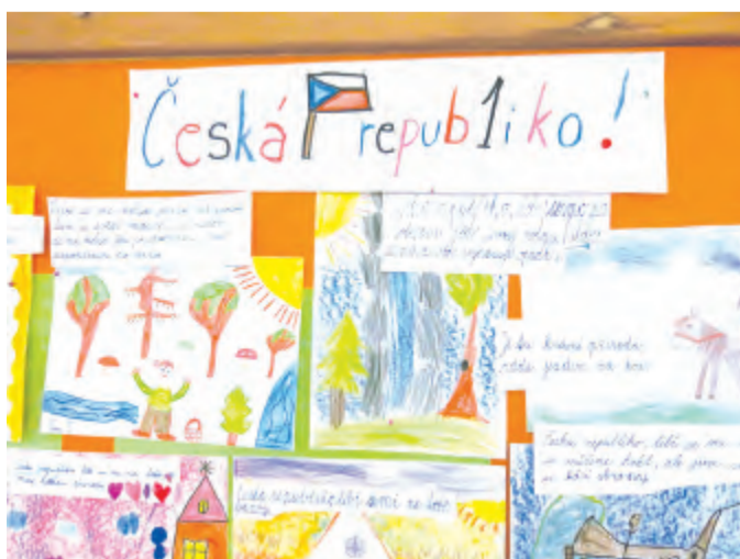
Tematická díla obohacená o vzkazy

V rámci projektu „ČR 25“ diskutovali starší žáci v hodinách dějepisu a občanské výchovy se svými učiteli o kladech a záporách rozdělení Československa, zamýšleli se nad dobovými do-