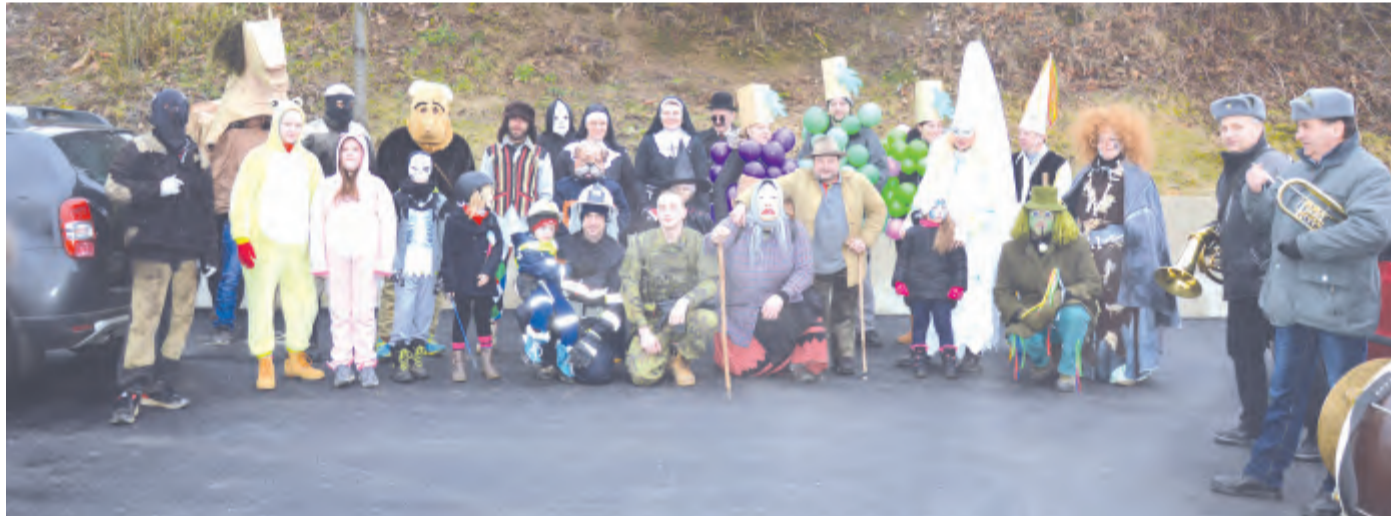
Společná fotografie masek u obecního domu. Maškarní průvod obci pak mohl začít.