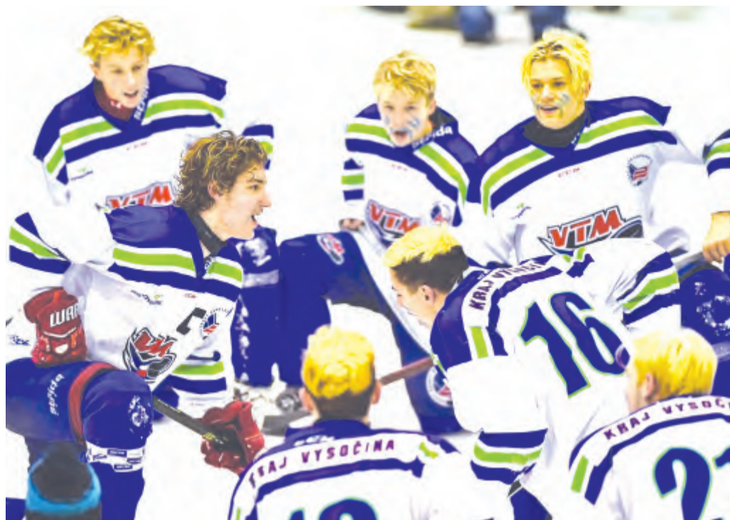
Zlatý hokejový tým z Vysočiny posílila na dětské olympiádě i šestice borců z BK Havlíčkův Brod