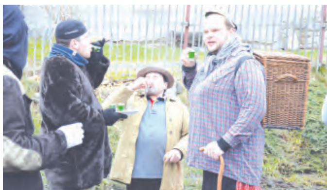
Výšlo pěkné počasí. Nepršelo, až pohádkově občas jemně zasněžilo. Sluňičko letos sice nehrálo, ale zahrála vždycky sklenička něčeho ostřejšího.

Pod názvem masopust se skrývá období od Tří králů (6. ledna) až do začátku postní doby, hlavně však poslední tři dny, kterými toto období končí. Ačkoli nejde o církevní svátek, termín masopustu se určuje podle data Velikonoc. Odehrává se před Popelčínou středou, která zahajuje předvelikonoční postní období. A protože Velikonoce jsou svátkem pohyblivým, může masopustní karneval připadnout na období delší než měsíc (od 1. února do 7. března). Letos je masopustní období dlouhé 38 dní.