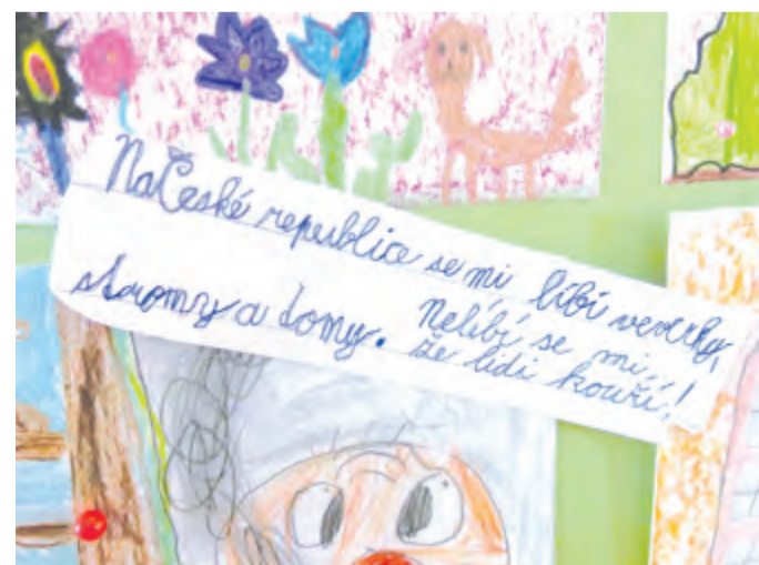
Výstava výtvarné soutěže