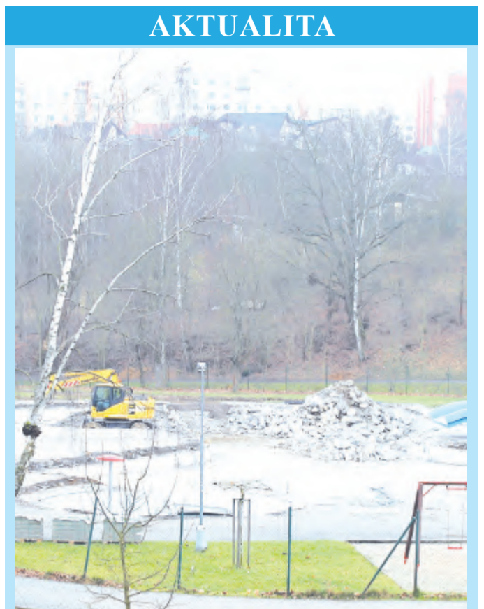
Brodské letní koupaliště právě prochází velkou přestavbou. Protože bazénové vany už byly poslední roky v havarijním stavu, přistoupilo město k jejich celkové rekonstrukci, a to ve výši 41 mil. korun. Oba bazény budou nově osazeny nerezovými vanami a přibudou i moderní dětské prvky. Pevně daný termín dokončení je 31. května t.r., takže letošní sezóna by neměla být ohrožena.