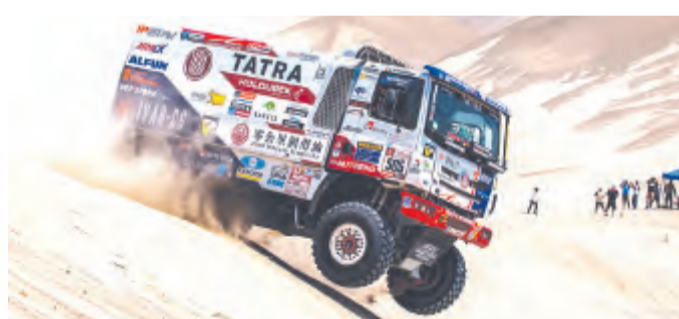
Všechny nástrahy nejtěžší rallye světa nakonec posádka kamionu č. 505 překonala