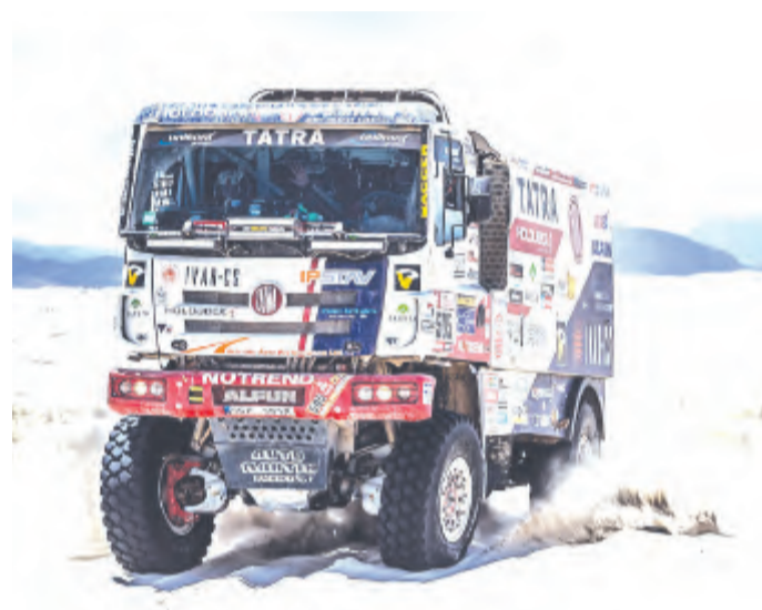
Trasa vedla horami i pouští